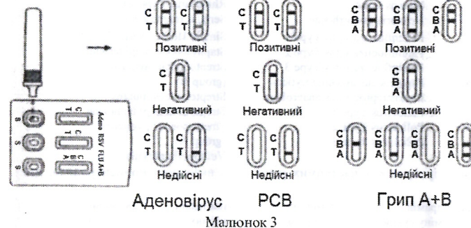
Аденовірус РСВ Грип А+В

Увага! Поява кольорової лінії на контрольній ділянці (С) завжди є контролем правильності виконання процедури.